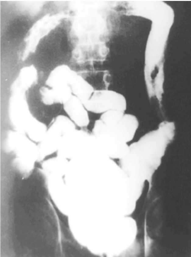
Figure 1 - Lavement baryté montrant un aspect tubulaire et rigide de tout le cadre colique avec images multilacunaires.

et entouré d'une sclérolipomatose (Fig. 2). Il a été réalisée une colectomie totale suivie d'une anastomose iléo rectale protégée par une iléostomie latérale 30 cm en amont dans la fosse iliaque droite.