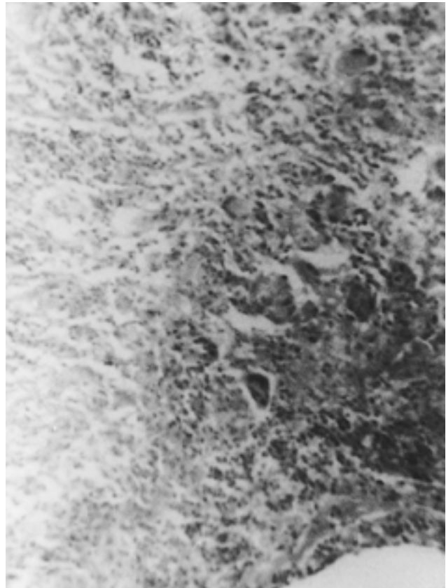
Figure 3 - Aspect de granulome inflammatoire bordant une ulcération avec des cellules géantes, épitheïoïdes et des lymphocytes

- au plan histologique : on notait de larges zones d'ulcérations de la muqueuse respectant des îlots ou pseudo polypes au fond desquelles existait un granulome polymorphe riche en néo-vaisseaux avec parfois des cellules géantes au contact de la nécrose.